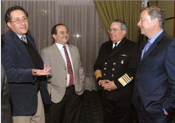
Foto: Los ministros ecuatorianos de Seguridad, Miguel Carvajal (i), y Defensa, Javier Ponce (2i), se reúnen hoy, 19 de noviembre de 2009, con el ministro de Defensa de Colombia, Gabriel Silva (d), y con el almirante de las fuerzas militares colombianas David René Moreno (2d), en Bogotá (Colombia), en donde reinstalaron la llamada Comisión Binacional Fronteriza (Combifron). EFE/Javier Casella/MINDEFENSA

“Lo que debemos hacer es tomar este nuevo abrazo entre los dos países con mayor fuerza y con el compromiso de profundizar nuestra confianza y nuestro compromiso de lucha por la equidad y la justicia”, expresó el ecuatoriano Ponce en la apertura de esta sesión.